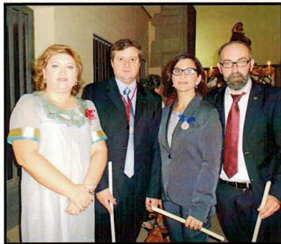
Procesión de San Francisco y Clara de Asís