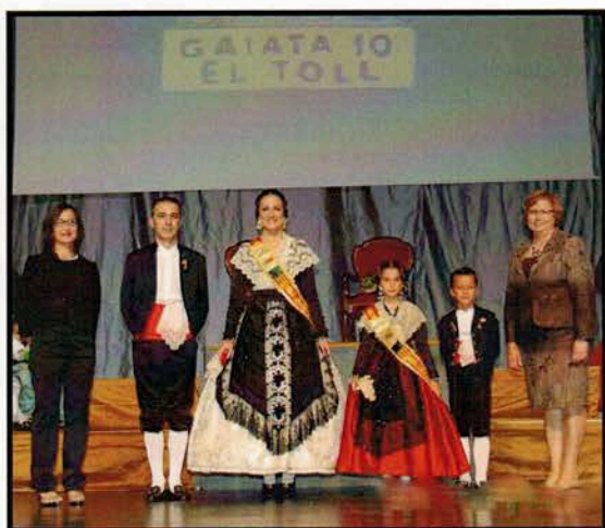
Ofrenda presentación Gaiata 10 El Toll