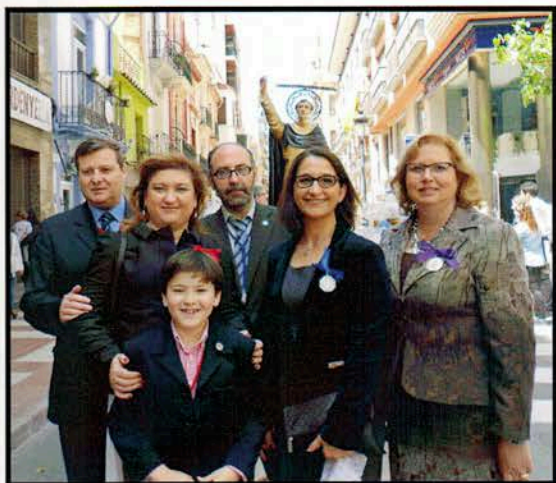
Procesión de San Vicente