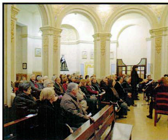
Concierto Coral "Pentecosta"