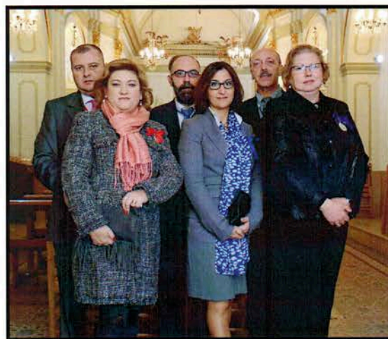
Procesión de San Nicolás