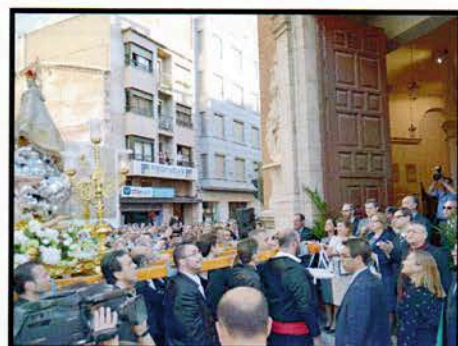
Año Mariano, recepción de la Virgen de Lidón en la Capilla de la Sangre