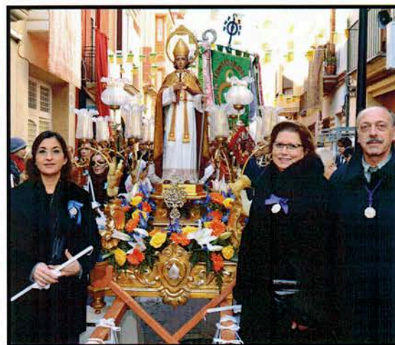
Procesión de "Sant Blai"