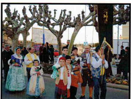
Ofrenda de flores a la Virgen de Lidón