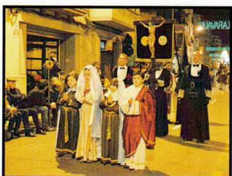
Procesión de penitentes y "les tres caigudes"