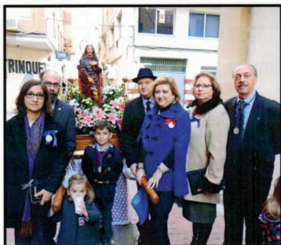
Procesión de "Sant Roc de Vora Sèquia"