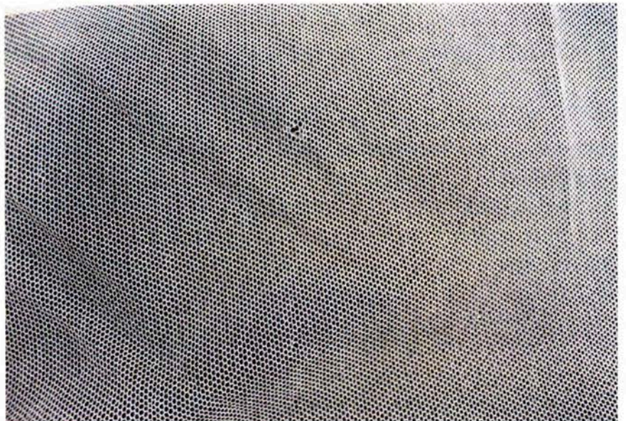
Detalle de pequeñas lagunas en el tul

Al tratarse de una pieza destinada al culto y a su uso en procesión, se recomienda no manipularla más de lo estrictamente necesario, siempre con el máximo cuidado, intentar evitar que se pueda mojar con la lluvia o subir otras inclemencias climatológicas y guardarla durante todo el periodo sin uso. Recomendamos guardarla enrollada, sobre un rulo de unos 15-20 cm. de diámetro y unos 125 cm. de largo. En caso de no poder guardarse enrollada, habría que mantenerla bien plegada pero evitando que se marquen esos pliegues usando material de relleno que amortigüe. Es preferible guardarlo tapado con una tela de algodón desaprestada que con papeles de seda o similar.