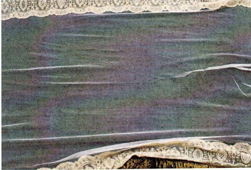
Detalle de las deformaciones del tul

Se aconseja tener la pieza en las mejores condiciones climática posibles, esto es, de manera ideal, no superar los 50 lux y mantener una temperatura y humedad relativa constante, en torno a los 50-55% de humedad y entre 18-22° C. Limpia de polvo, insectos y roedores.