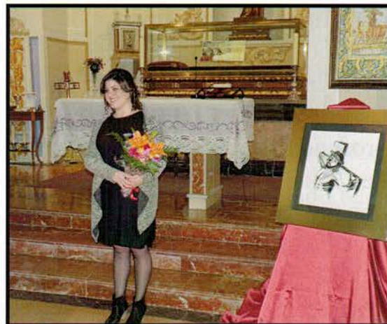
Presentación del Cartel de Semana Santa